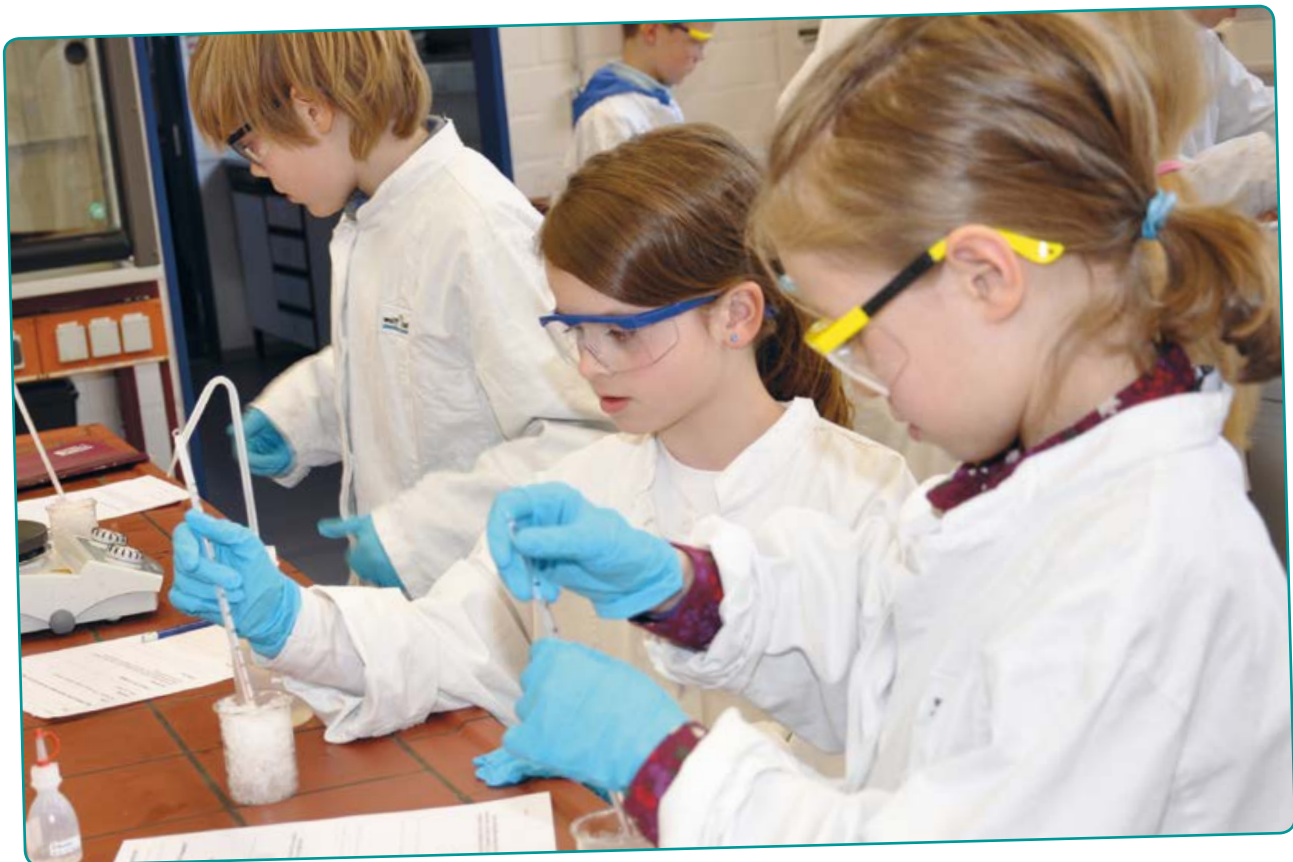
Im Agnes-Pockels-SchülerInnen-Labor forschen Schulklassen aller Altersstufen.

Petra Mischnick wollte als Kind erforschen, ob sie sich im Schlaf bewegt. Bildet Forscherteams und überlegt, was ihr gerne erforschen würdet. Denkt euch dazu ein passendes Experiment aus und stellt es der Klasse vor. Könnt ihr das Experiment auch tatsächlich durchführen?